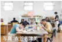
アートセンターHANA アトリエの様子