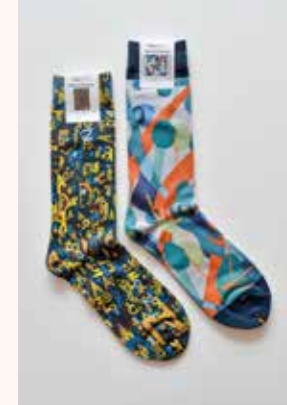
Able Art Company×Tabio