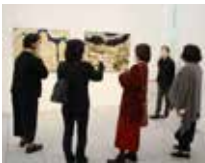
昨年のギャラリートツアー