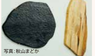
たたいて みがいて つくる木の仕事