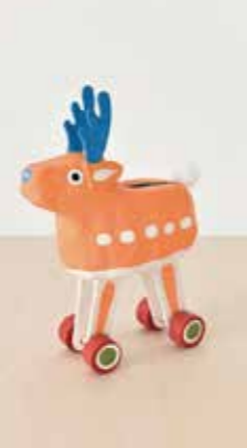
「鹿コロコロ」 企画:株式会社中川政七商店