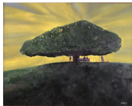
《丘の上の大樹》1991年 大分県立美術館