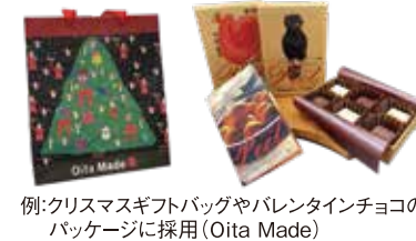
例:クリスマスギフトバッグやバレンタインチョコのパッケージに採用(Oita Made)

障がいのある人の表現が、民間企業・団体や行政機関の取り組みによって、私たちの日常の様々な場面に登場しています。大分のアーティストの作品の活用事例を紹介します。