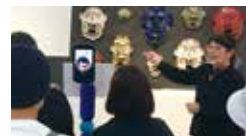
アバターを使った作品紹介