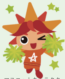
マスコットキャラクター アビリス